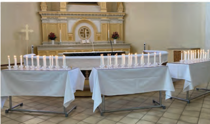
Muistojen ilta tuomiokirkossa. Kynttilä sytytettiin luovutetun Karjalan pitäjien ja muiden paikkojen muistoksi.