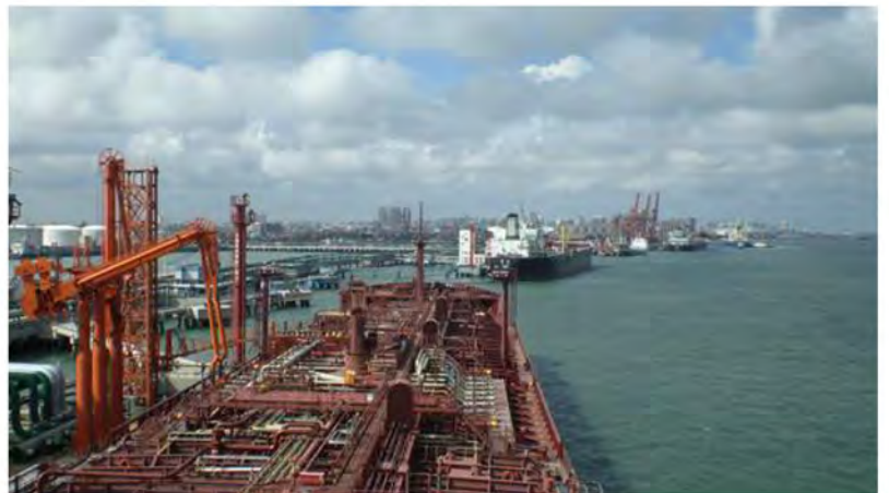
Tankkeri Palva satamassa Kiinassa.