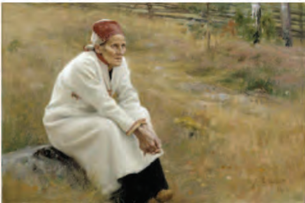
Albert Edelfelt, Larin Paraske 1893. Viipurin-säätiön kokoelmaa, nykyään Hämeenlinnan taidemuseossa.