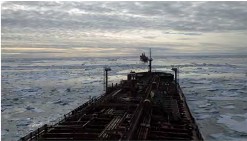
Tankkeri Palva Koillisväylällä.