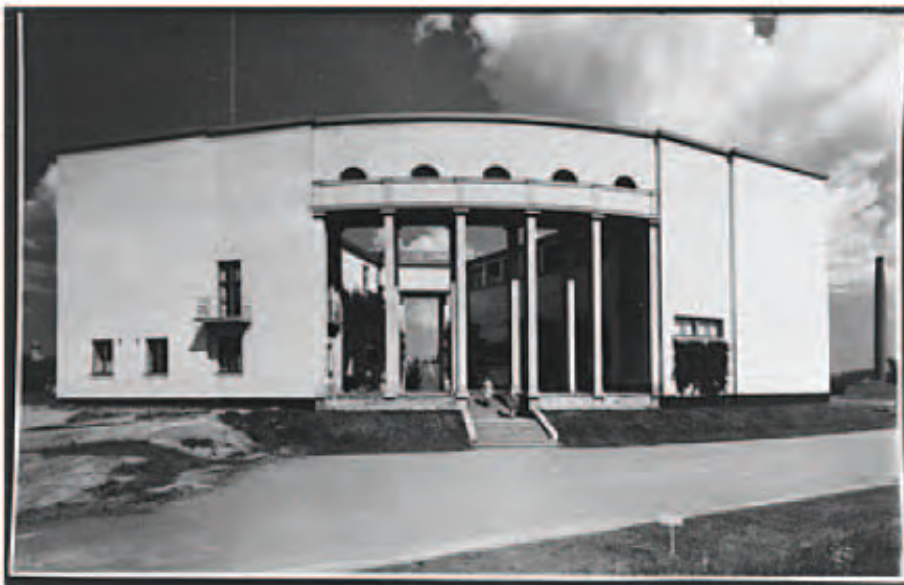
Viipurin Taidemuseo 1930-luvulla.