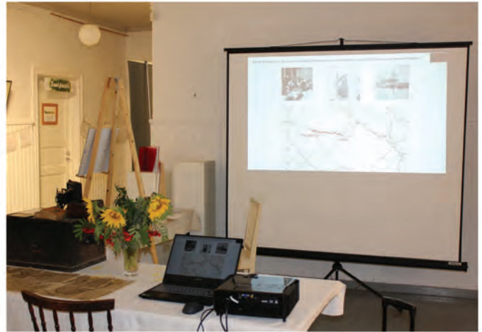
Evakkomatkakertomuksia esitettiin kuvitettuina videoesityksinä valkokankaalle.