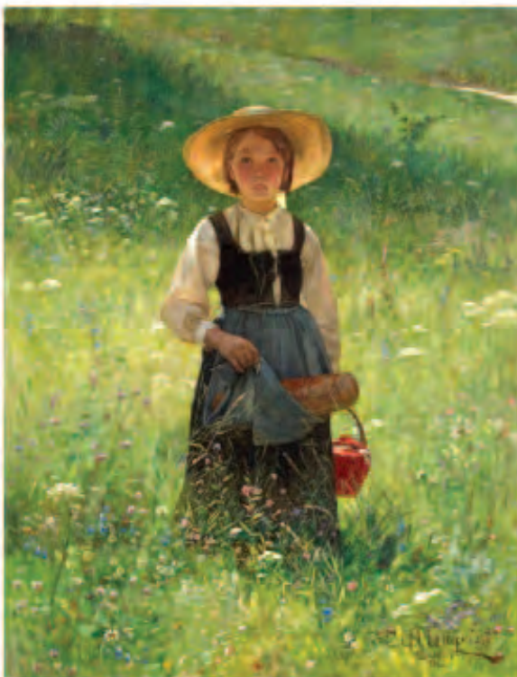
Carl Gustaf Hellqvist, Tyttö kukkivalla niityllä 1883. Teos Viipurin taidemuseosta, nykyään Hämeenlinnan taidemuseossa.