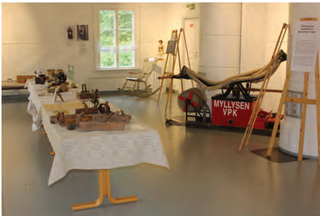
Vahvialan Tervajärven Myllysen VPK:n paloruisku on edelleen toimintakuntoinen. Esinevalikoimassa oli huonekaluja, käsityökaluja, kodinhoito- ja keittiötarvikkeita. Vahvialan murteesta kirjoitettu näyte oli laitettu vieraiden luettavaksi.