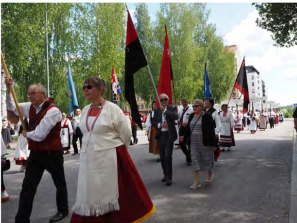
Kulkue Mikkelissä.