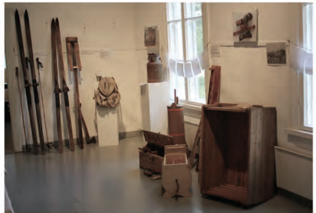
Etualalla on puulatikko, johon oli pakattu junakuljetukseen jääneet evakkotavarat. Häsälän kylä oli kuuluisa puuastioista, kuvassa myös niiden valmistuksessa käytettyjä käsityökaluja. Sotataipaleelta on jäänyt reppu, muki ja lusikkahaarukka muistoksi. Taustalla kotitekoiset kokopuusukset ja niiden valmistuksessa tarvittava kärkien taivutin.