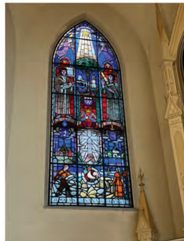
Mikkelin tuomiokirkon lasimaalaus.