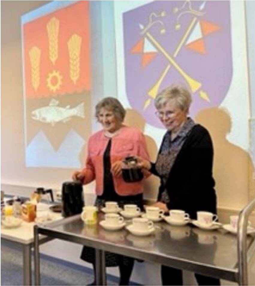
Kahvitarjoilu on oleellinen osa perinnepiirin tapaamisissa.