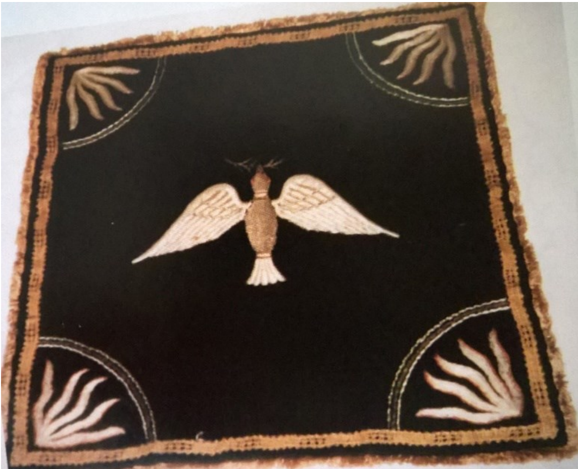
Kalkkiliinat ovat kyyhkyskuvioiden ja kullanvärin kirjailuin somistettuja.