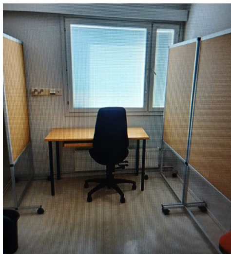
Seinäkkeet saatiin lainaksi Myllykosken kirjastosta.

Näyttelyn pystytyksen vaiheisiin ja avajaistunnelmiin pääset seuraavilla sivuilla.