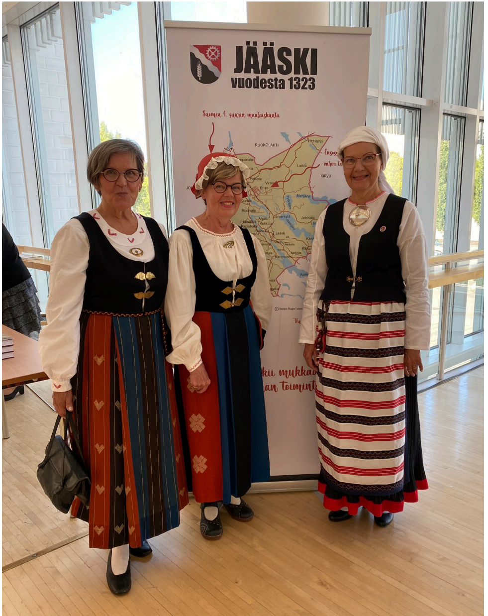
Upeat Jurvan sisarukset kansallispuvuissaan.