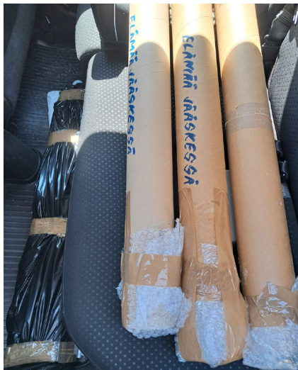
Jääsken infotaulut tulivat talkoolaisten mukana auton takapenkillä Imatralta Anjalaan