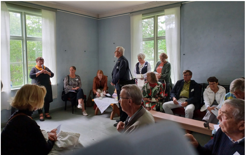
Saimme vieraita muun muassa Karjalaisten Pitäjähdistysten liitosta, Antrea-Seurasta, Kirvun Pitäjäseurasta ja Kirvu-Säätiöstä. Kouvolan matkailuoppaat kertoivat juhlaväelle kartanon ja lähialueen historiasta.