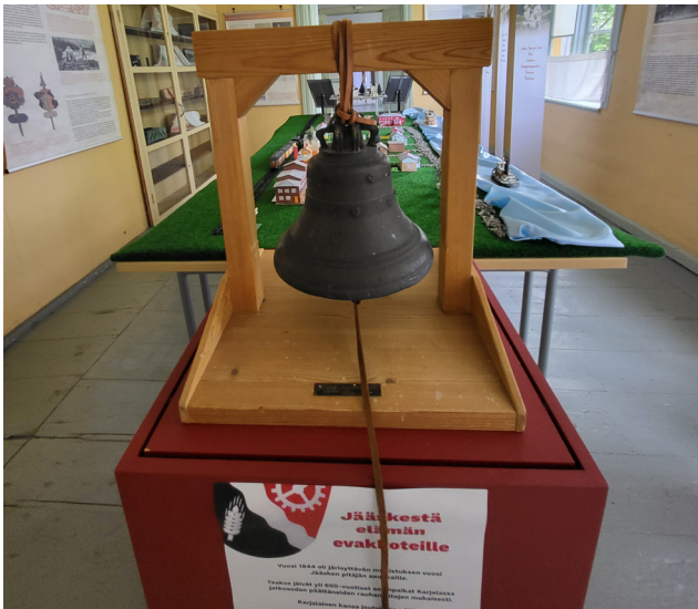
Jääskén pappilan kello haettiin kesän ajaksi näyttelyyn Korian kirkosta.