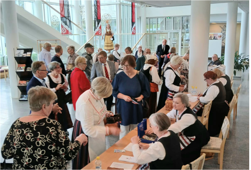
Jääksen Kihujen pääjuhla oli Kulttuuritalo Virrassa Imatralla.