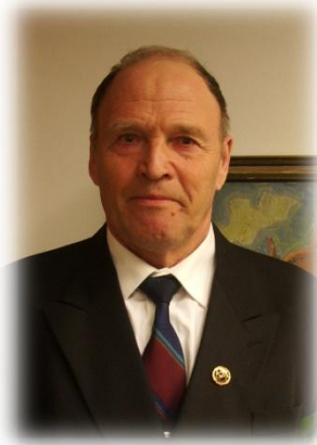
Kirjoittaja: Arvi Akkanen Karkkilan Karjalaiset ry:n sihteeri