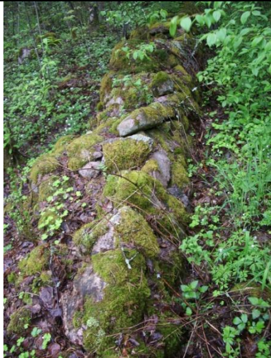
Heinjoen kirkolla olevan hautausmaan lisäalueen kiviaitaa kesällä 2009.