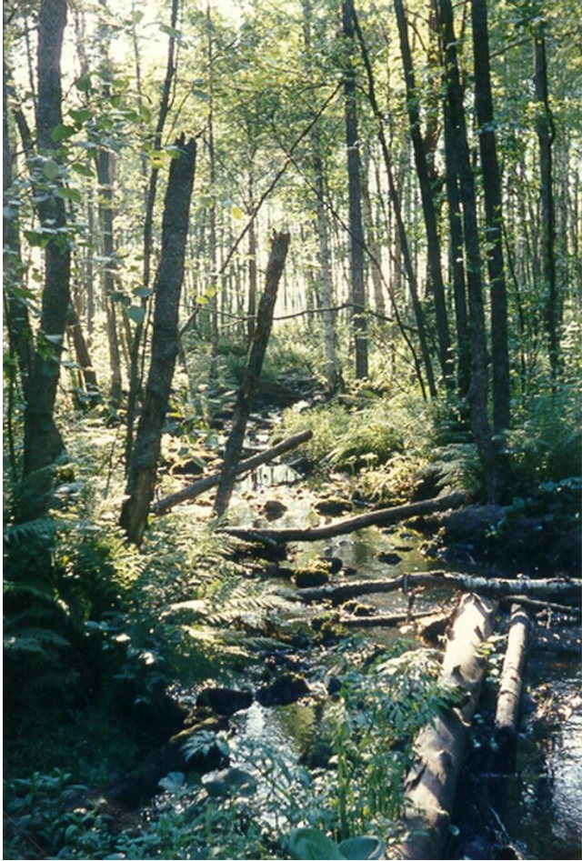
Raajoki virtaa Pappilanjärvestä Rouhijärveen.