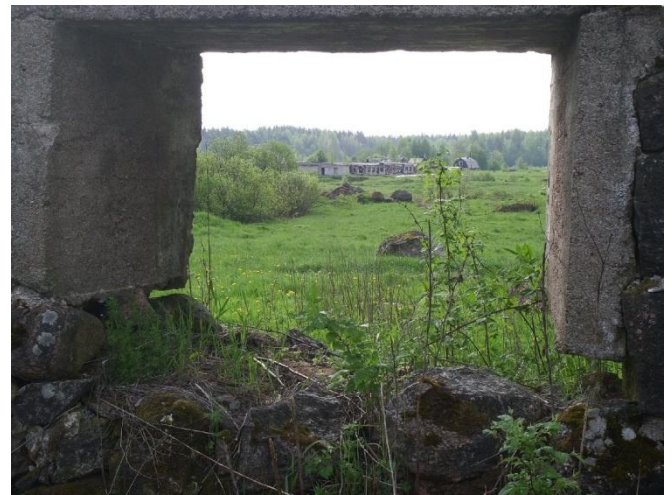
Näkymä kunnan kivinavetan raunioilta Rouhimäkeen päin, jossa näkyy hyljätty sikalan rakennus.

"Kunta" niin kuin sitä kunnalliskodin kokonaisuutta silloin nimitettiin, oli maatila, jossa oli 22 hehtaaria peltoa ja muuta yhteensä 400 hehtaaria. Rajat kulkevat seuraavasti: kunnalliskodista Leinolaan päin, alueen rajana oli Hovilah-ti ja Salmenoja. Salo-Vamppala - tien Rouhijärven puolella oli myös kunnan maata, joka jatkui kunnalliskodin muuntajalta kirkolle vievälle tielle aina Parikalle asti. Kanttorin tonttikin oli lohkaistu tästä tilasta. Kunnalliskodin lähimpi-rissä olivat tämä suuri navetta, hevostalli, suuri erillinen saunarakennus, aittoja sekä tilanhoitajan ja muonamiehen talo navetasta n. 30 metriä Leinolaan päin tien varrella.