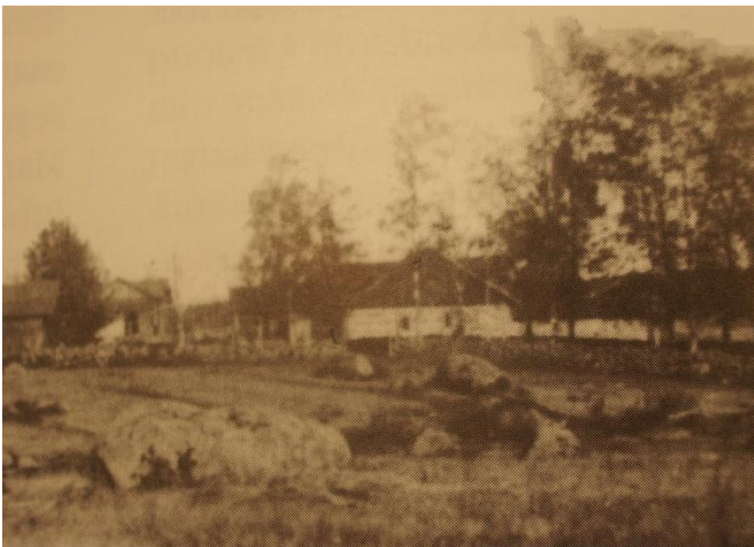
Kanttorilasta päin katsottuna kivinavetta on keskellä kuvaa, joka on otettu 20-luvulla.